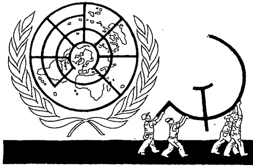
Illegible text below the illustration.